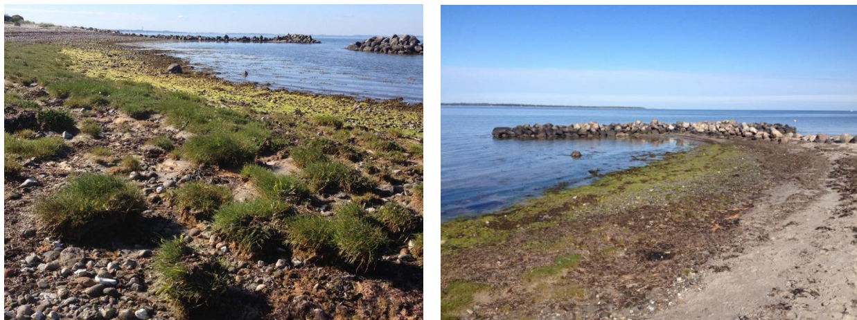
Figur 2: Billeder fra den eksisterende kyststrækning. Billeder fra maj 2019.

Her tages udgangspunkt i forholdene i den nordlige del af sikringssystemet. Her virker sikringen, og der er opstået sandstrandsområder af rekreativ værdi. På den baggrund ønskes det derfor at reducere afstanden mellem hølferne i de to sydligste bugter, så bølgepåvirkningen under stormsituationer formindskes. Det gøres ved at forlænge de allerede eksisterende små bølgebrydere og forbinde dem til land, som på den øvrige strækning. Herved reduceres også den landskabelige påvirkning og det vil resultere i, at mere sediment vil blive tilbageholdt.