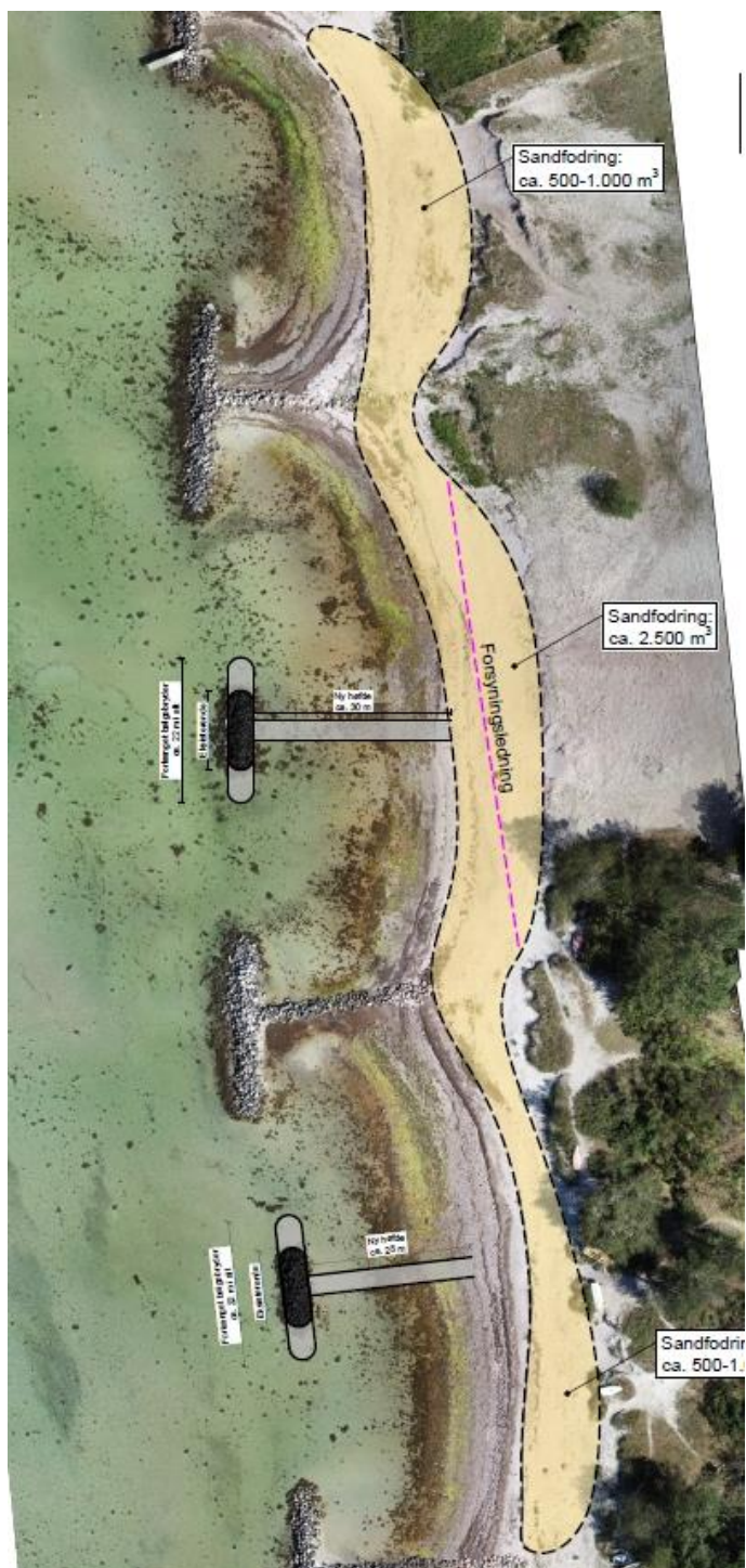
Figur 1 – principskitse over placering af sandbuffer og etablering af højder

Ved Lynæs er det akut erosion, som er den primære årsag til, at sand fra stranden forsvinder. Når der skal kystsikres mod akut erosion, skal kystsikringen fungere som buffer for bølgepåvirkningerne under stormsituationer.