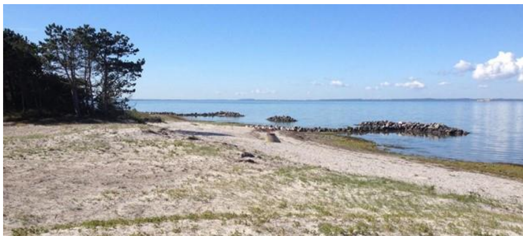
Figur 4 - billede af kysten imod syd

I den kommunale Natura 2000-handleplan fremgår, at der skal prioriteres sikring af rastelokaliteter for edderfugle, sikring af en fortsat pleje af våd eng (6410) og rigkær (7230) samt sikring af en hensigtsmæssig hydrologi og bekæmpelse invasive arter (Odsherred og Halsnæs Kommuner, 2017).